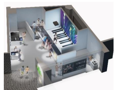
「サウンド」展示室パース図

※新展示室「サウンド」は、“「遊び」「創造」「発見」の森”をコンセプトとしたFOREST(フォレスト)展示室群の一室です。さまざまな体験を通じて、何かを感じ取ることができる仕掛けがいっぱいのエリアです。