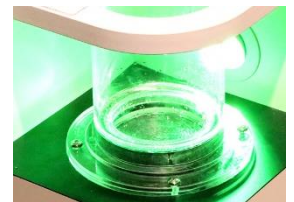
「アクア・ウェーブ」

目には見えない「音」を可視化するこれらの新展示を通して、子どもを中心とした一般の人々が全身を使って科学や技術への興味を高め、また学ぶ機会を提供していきます。