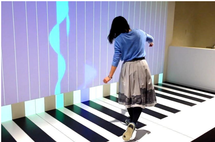
「ジャンボ・ピアノ」

音によって変化する水面の様子を観察する「アクア・ウェーブ」や、同じく音によって変化するレーザーの光跡を観察する「レーザー・ダンス」、鍵盤をふむと音が出るとともにそれに応じた色やかたち、大きさの波があらわれる「ジャンボ・ピアノ」など、体感型の展示物で構成した特別な空間です。